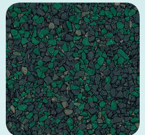
Yosemite Green CC074A