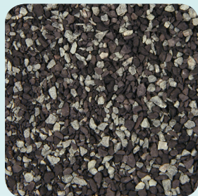
Pewter Gray CC010A