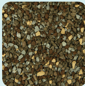
Weathered Wood CC004